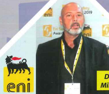
Direction ENI Milan juin 2019

Notre engagement depuis 20 ans au MASE (Manuel d'Amélioration à la Sécurité d'Entreprise) nous a permis de développer une véritable politique QSSE qui contribue à notre amélioration continue, au respect écologique, à la fiabilité QSSE des procédures et à la responsabilité sociétale. Ces valeurs sont reconnues et récompensées par de grands industriels.